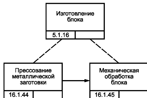
Рисунок В.3 — Блок-схема процесса изготовления блока цилиндров изделия GT-350 [10]

Блок цилиндров изделия GT-350 изготавливают в виде под сборки двигателя этого изделия, что предусматривает работы литейного производства и цеха механообработки (см. рисунок В.3).