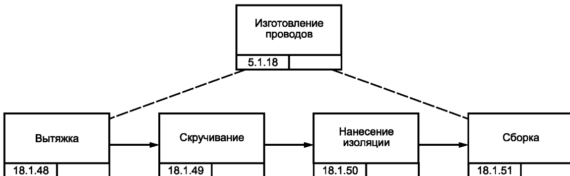
Рисунок В.6 — Блок-схема процесса изготовления проводов для изделия GT-350 [8]

Комплект жгутов проводки для изделия GT-350 изготавливают в виде под сборки двигателя этого изделия, что предусматривает работы кабельной мастерской.