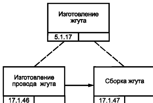
Рисунок В.4 — Блок-схема процесса изготовления жгутов для изделия GT-350 [8]

Жгуты изделия GT-350 изготавливают в виде под сборки двигателя этого изделия, что предусматривает работы кабельной мастерской (см. рисунок В.4). Рисунок В.5 более подробно иллюстрирует процесс изготовления жгута, сборку которого выполняет монтажник в кабельной мастерской, что занимает у него 10 мин на один комплект.