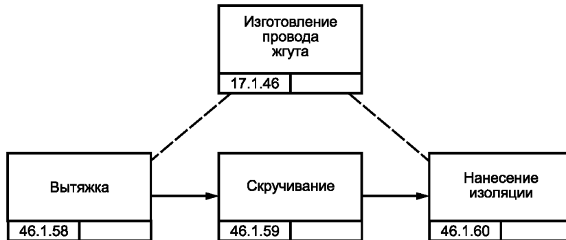
Рисунок В.5 — Блок-схема процесса изготовления жгута проводки [8]

Процесс assemble_harness требует привлечения одного ресурса — жгута. Поскольку этот ресурс используется в этом процессе и не расходуется, то объем ресурса (определенный функцией resource_point ) не изменяется при любом элементе процесса assemble_harness .