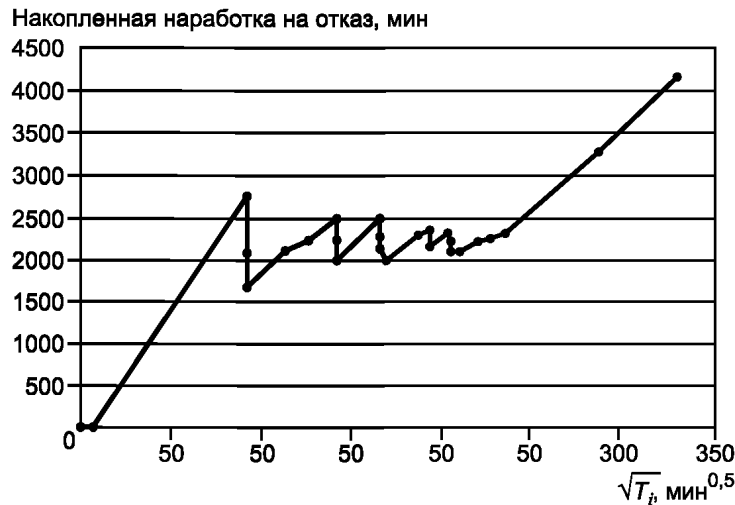
Рисунок Б.1 — График роста безотказности по данным таблицы Б.1